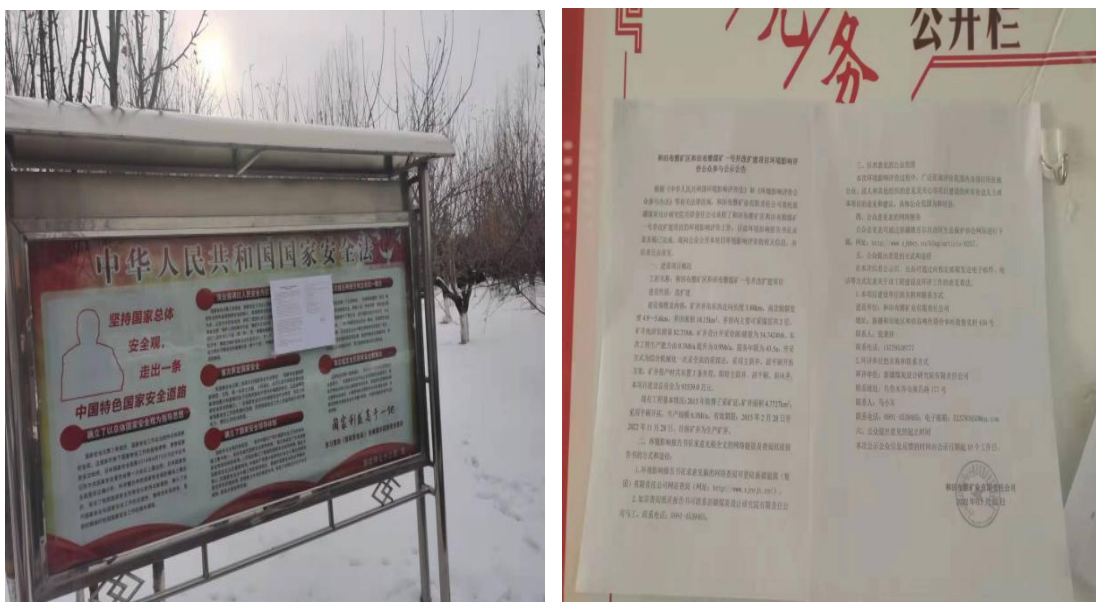
喀什塔什乡政府公告栏