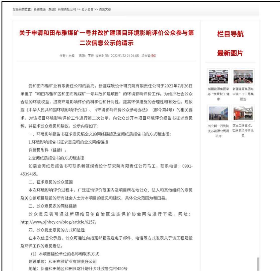
图 3.2-1 征求意见稿网上公示截图