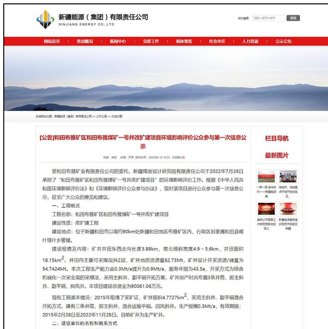
图 2-1 第一次公众参与网络公示截图

(http://www.xjnyjt.cn/) 发布了《和田布雅矿区和和田布雅煤矿一号井改扩建项目环境影响评价公参与第一次信息公示》，新疆（能源）集团有限责任公司是我公司全额控股公司。在该官网发布本项目环评信息公示，符合《办法》中规定要求。第一次公众参与网络公示截图详见图 2-1。